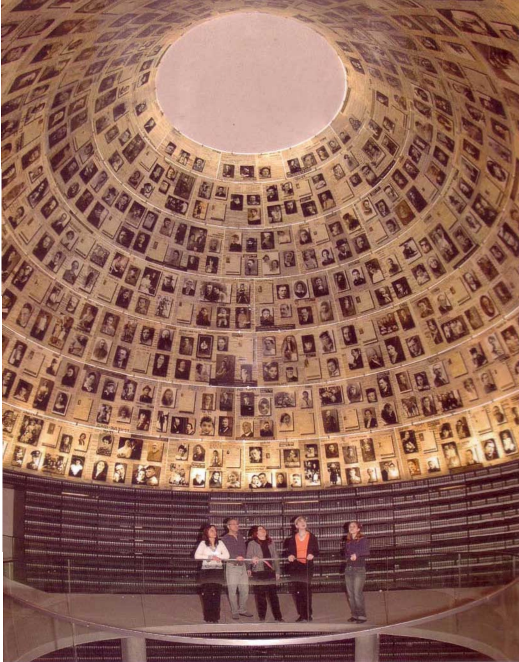
Salle des Noms, Musée d'Histoire de la Shoah Yad Vashem, Jérusalem